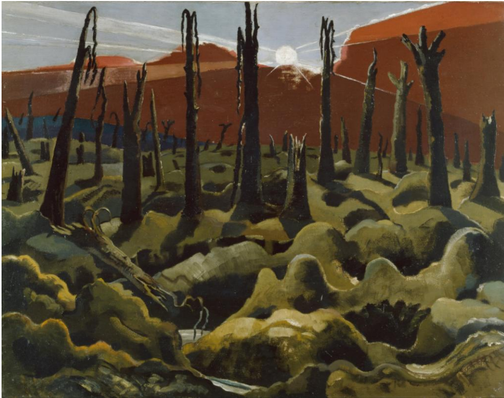
Paul Nash, We are making a new world , 1918. Huile sur toile, 71,1 par 91,4 cm, Imperial War Museum, Londres.